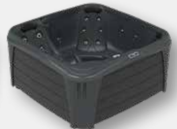
NIGHT / SCHWARZ