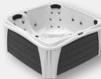
SNOWWHITE / SCHWARZ