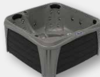
MYSTIC / SCHWARZ