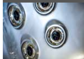
DÜSENABDECKUNGEN AUS EDELSTAHL