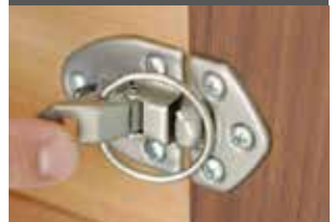
AUFBAU OHNE SCHRAUBEN