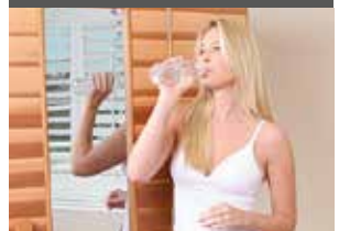
TÜRFENSTER AUS SPIEGELGLAS