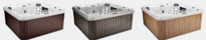
MAHAGONI GRAU WALNUS