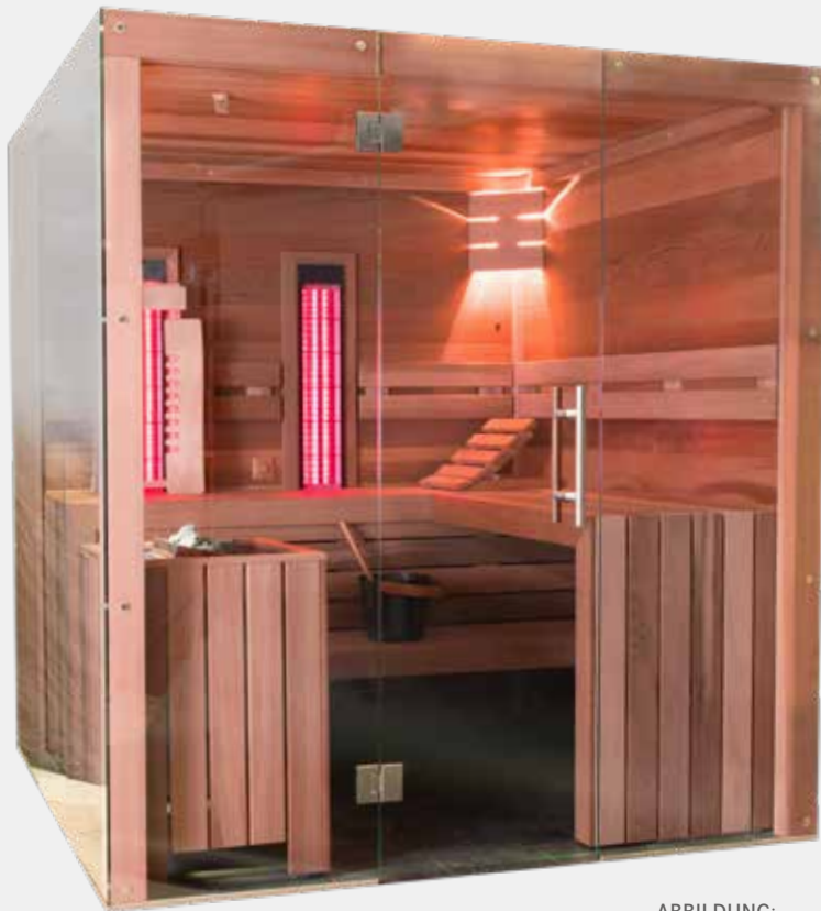
ABBILDUNG: AUSFÜHRUNG ZEDER

Das Modell VidroFinn XL lässt sich wahlweise als Infrarotkabine oder als Sauna nutzen.