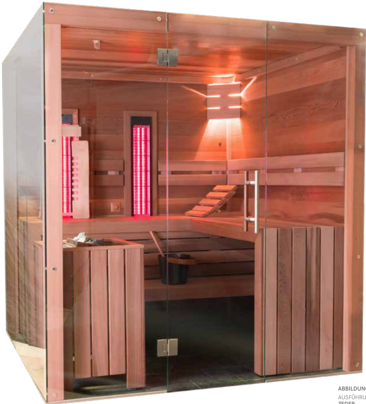
ABBILDUNG: AUSFÜHRUNG ZEDER

ERHÄLTlich IN DREI VERSCHIEDENEN AUSFÜHRUNGEN